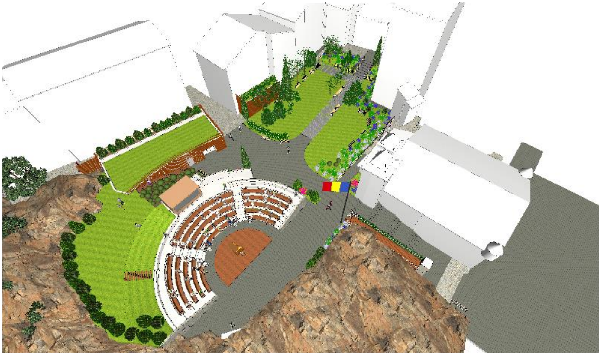
Presentació del projecte arquitectònic de la part posterior de Casa de la Vall Xavier Aleix Arquitecte - Xaa